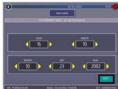
FIGURE 3 - TOURNAMENT CLOCK