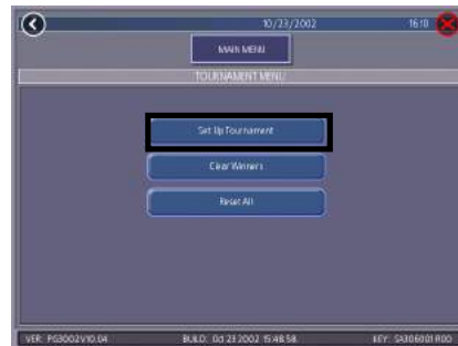
FIGURE 2 - TOURNAMENT MENU SCREEN