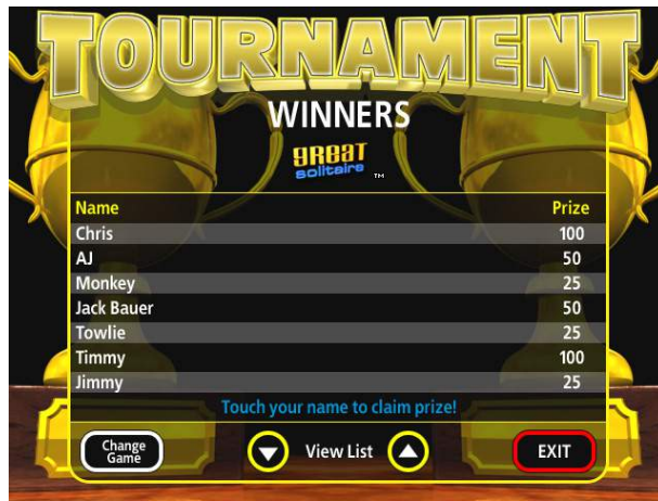
FIGURE 5--WINNERS' SCREEN