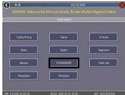
FIGURE 1 - TOURNAMENT MENU SCREEN